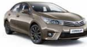
4V8 Бронзовий 2