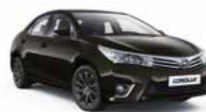
4U5 Коричневий 2