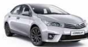
1F7 Сріблястий 2