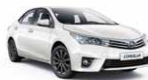
070 Білий перламутр 2