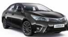
1H2 Темно-сірий 2