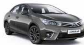
1G3 Сірий 2