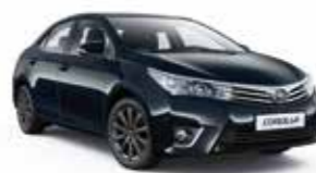
209 Чорний 2